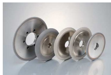
フルートマスター