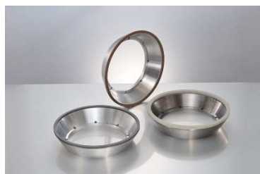
フランクマスターシリーズ