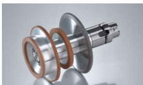
工具研削用ダイヤモンドホイール