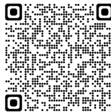
お申込みフォーム