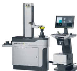
ツールプリセッター