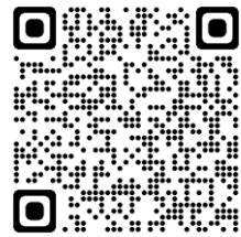
お申し込みフォーム